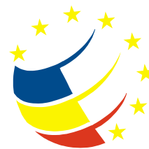
Inovație în administrație Programul Operațional "Dezvoltarea Capacității Administrative"